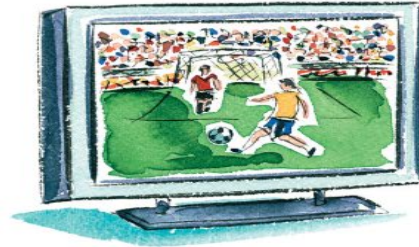
▶ une retransmission sportive