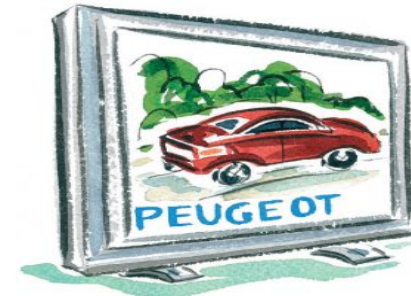
▶ une publicité