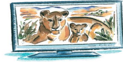
▶ un documentaire