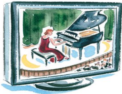
▶ une émission de musique