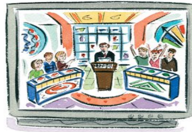
▶ un jeu télévisé