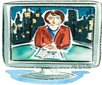
▶ le journal télévisé, les informations (les infos) ( f. pl. )